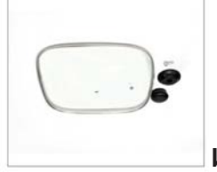
Partes de la tapa de vidrio (Tapa, Perilla, Juntas, un Tornillo).