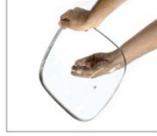
Inserte el tornillo en el orificio de la tapa de vidrio.