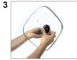
Align gasket and knob, insert screw into hole of gasket and knob.