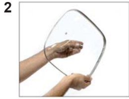
Insert the screw into the hole of glass lid.