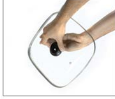
Alinee la junta y la perilla y coloque el tornillo en el hueco.