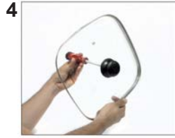
Tighten the screw.