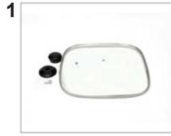
Parts of glass lid for skillet pan (Lid, knob, Gasket, one screw).