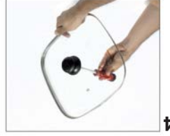
Fije el tornillo a la perilla usando un destornillador.